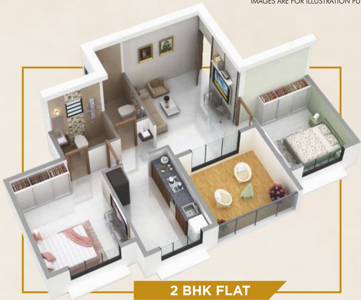
2 BHK FLAT