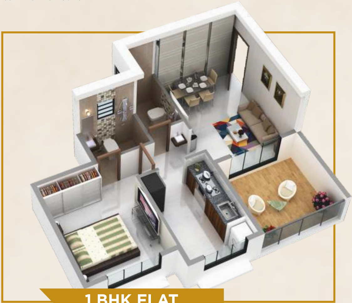
1 BHK FLAT